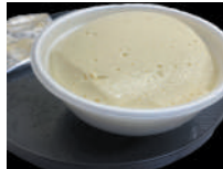
受賞商品「できたておぼろ豆腐」