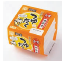
受賞商品 「おちびさんつゆだく」