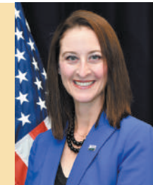
米国大使館 農産物貿易事務所 所長 チャンダ・パーク氏

SSAP認証の大豆が日本の大豆製品に使われ、食文化の向上に貢献しているのを見て、とても嬉しく思います。今後も引き続き、USSECとの連携を続け、アメリカの大豆生産者と日本の食品業界との強い結びつきをサポートしてまいります。おめでとうございます！